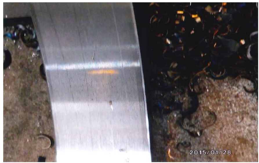
④加工後の面取り状況

販売元：株式会社パル 〒101-0032 東京都千代田区岩本町2-17-17 tel:03-3851-5821 / Fax:03-3851-5810