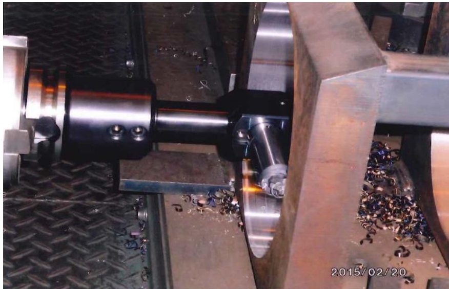
③ テスト加工 Φ260 / 回転数:80m～100m, 送り:0.2～0.5/rev